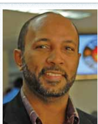
Bebeto: políticas públicas de inclusão nas universidades e nas empresas