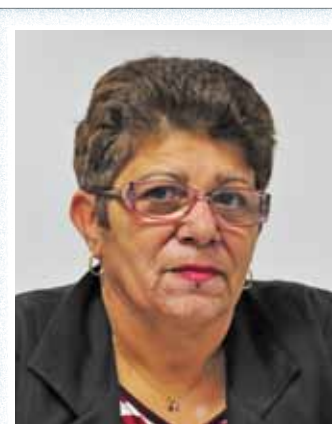
Auxiliadora: luta árdua para acabar com o preconceito no trabalho