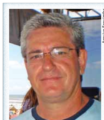
Scaboli: "Departamentos de saúde e segurança em todos os segmentos"

nada diária. "Mas o movimento sindical, empresários e governo estão atualizando e criando normas de proteção".