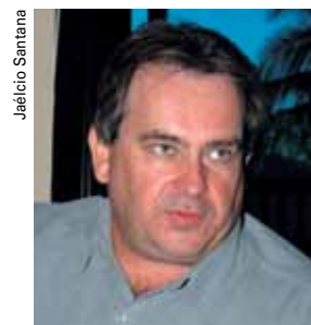
Butka: “Eliminar todas as formas de trabalho forçado, como o infantil”