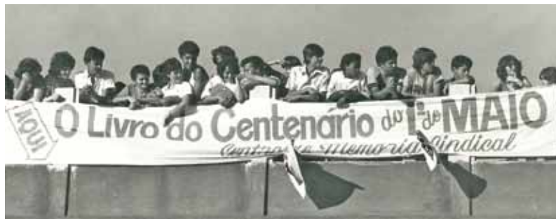
Laçamento do Livro Primeiro de Maio, pelo Centro de Memória Sindical, em 1986