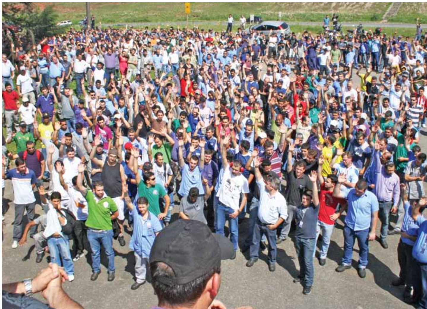
Os trabalhadores, assim como os metalúrgicos da WHB, do Paraná, lutam pela redução dos juros e pela valorização do salário

“Também queremos que o governo deflagre um combate sistemático ao contrabando e à pirataria”, enumera a dirigente.