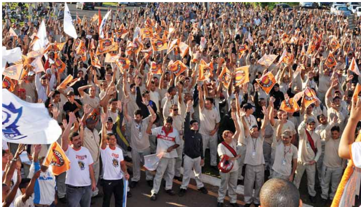
Com o lema "Chegou a hora da onça beber água", os metalúrgicos de Catalão fecharam um dos melhores acordos do país