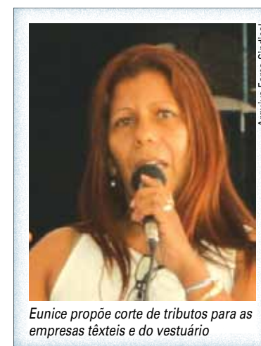
Eunice propõe corte de tributos para as empresas têxteis e do vestuário