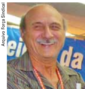
Dal Prá: “Uma conquista para os filiados e trabalhadores